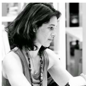
Madina Circuit vignobles et conférence