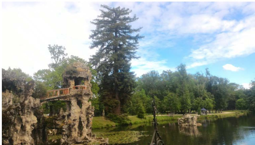
Le Parc de Majolan