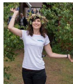
Elsa Programmation artistique