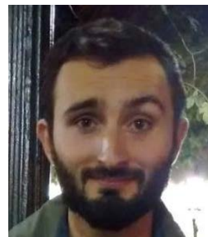
Thomas Village associatif