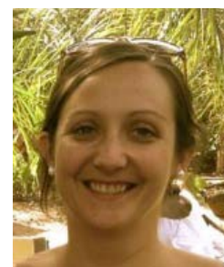
Marike Village associatif