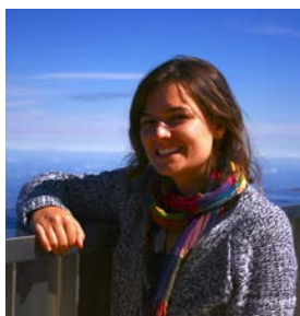
Béatrix Gestion des bénévoles