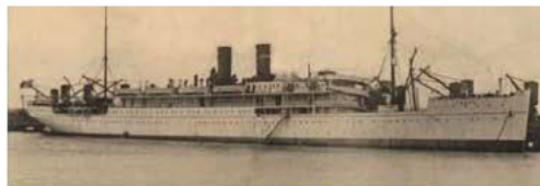
Le Paquebot « Pérou » de la Compagnie Générale Transatlantique

de sa destination finale aux Antilles et en Amérique centrale, à une époque où la cité pauillacaise possédait un port transatlantique très actif.